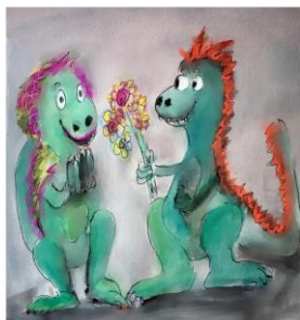
Drachenhochzeit Märchen von Peter Futterschneider

Prinzessin Klara freut sich auf ihre Hochzeit mit König Michael. Plötzlich werden die Vorbereitungen von einem Hilferuf aus dem Reich ihres Bruders unterbrochen. Dort machen sich alle große Sorgen um den Drachen Dragomir. Klaras Entschluss ist schnell gefasst: Die Hochzeit muss warten, denn Freunden hilft man in der Not. Sie findet einen müden und traurigen Drachen vor, den nur noch ein Kartenspiel mit der Wache aus seiner Höhle locken kann. Eine knifflige Aufgabe wartet auf Klara. Doch sie ist nicht allein und wird tatkräftig von Julia, der Wache und einer resoluten Drachendame unterstützt.