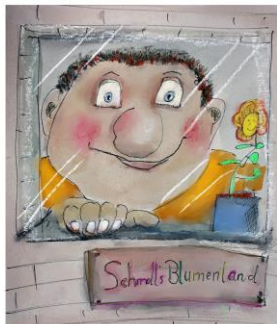
Der Riese Schmoll Kinderstück von Peter Futterschneider

Die beiden Riesen Groll und Schmoll bewachen einen Obstbaum und vertreiben alle Menschen, die gern davon naschen möchten. Schmoll mag aber eigentlich nicht böse sein. Er würde sich viel lieber um bunte, duftende Blumen kümmern. Eines Tages hat Schmoll genug und läuft davon. Auf einer wunderschönen Blumenwiese findet er mit dem Mädchen Julia und dem jungen Schneider Tom neue Freunde. Mit deren Hilfe möchte sich Schmoll einen Traum erfüllen: Einen eigenen Blumenladen in der Stadt. Doch auf dem Weg zu diesem Traum gibt es Hindernisse zu überwinden: Der König verbietet den Riesen jeden Handel in der Stadt. Inzwischen sucht Groll seinen alten Freund und vergisst dabei, dass er eigentlich ein grolliger Riese ist. Die Menschen lernen ihn von seiner guten Seite kennen. Bald bekommt er mit der Wache des Königs tatkräftige Hilfe bei der Suche nach Schmoll. Prinzessin Klara bringt einige Turbulenzen in diese Geschichte, die natürlich ein glückliches Ende nimmt.